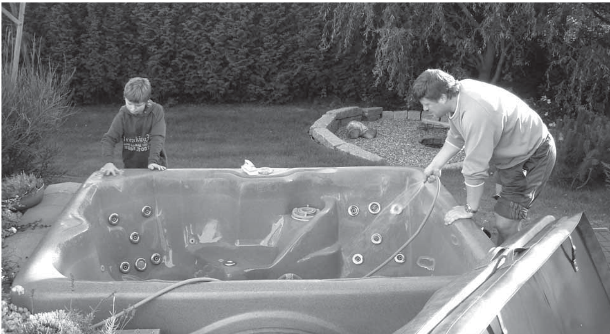
Práce na zahradě představuje pro otce příležitost, jak se zapojit do rodinného života a chodu domácnosti (Klecany, 2007)