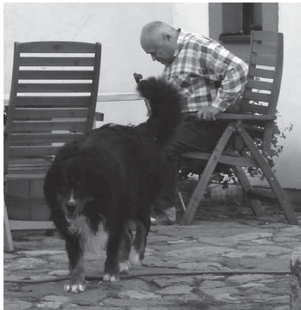
Vhodně uzpůsobený mobiliář by měl být základním požadavkem zahrad pro starší uživatele (Šlapanice, 2007)