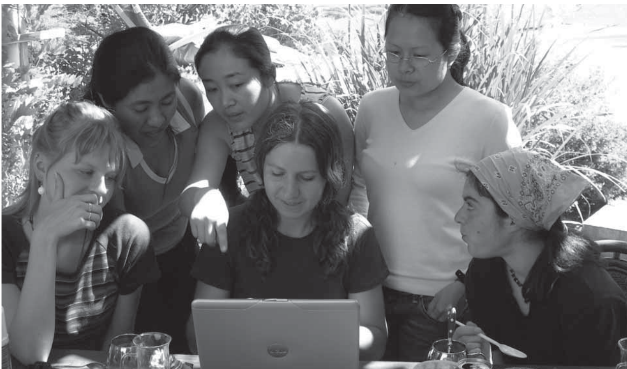
Díky notebookům, mobilním telefonům či wi-fi připojení na internet může v zahradě vzniknout letní pracovní (Praha, 2006)

Předškolní děti vyžadují dostatek podnětů pro svou zvědavost ( rostliny přitahující hmyz a ptáky, přírodní vodní biotop s vodními živočichy, ovoce a zelenina k ochutnání ). Narůstá jejich nezávislost daná větší mobilitou dítěte, která umožňuje průzkum okolí ( nutnost bezpečnostních opatření u bazénu/jezírka, vstupu do ulice ). Rozvíjí se dětská představitivost a svalová koordinace ( pískoviště, stavebnice, chodník/tabule na kreslení ). Navazují se první kontakty s vrstevníky, kdy se děti učí sdílet věci s ostatními ( dostatečně velká plocha trávníku pro hry s kamarády ).