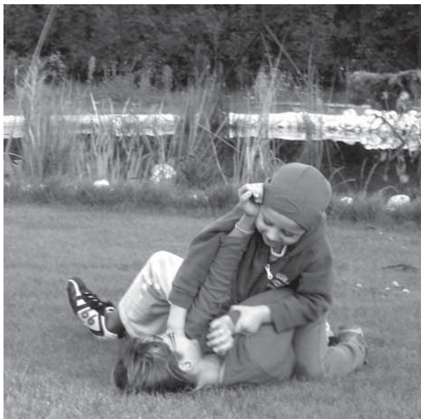
Dostatečně velká plocha trávniku je v zahradě s malými dětmi stěží (Vrané nad Vltavou, 2007)

Pro novorozence a batolata je nejdůležitější pocit bezpečí, proto vyžadují stálou přítomnost matky ( prostor pro umístění kočáru/postýlky u sušáku na prádlo, v letní kuchyni, v odpočinkovém koutu ). Nejmenší děti se seznamují s okolním prostředím především hmatem ( zastoupení různých povrchů v zahradě - trávník, dřevo, štěrka, voda ).