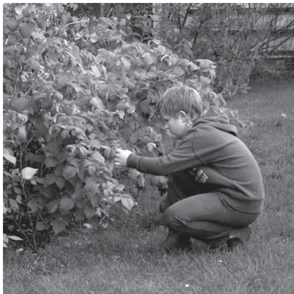
Ochutnávání ovoce představuje pro děti jeden z významných podnětů pro trávení času v zahradě (Klečany, 2007)