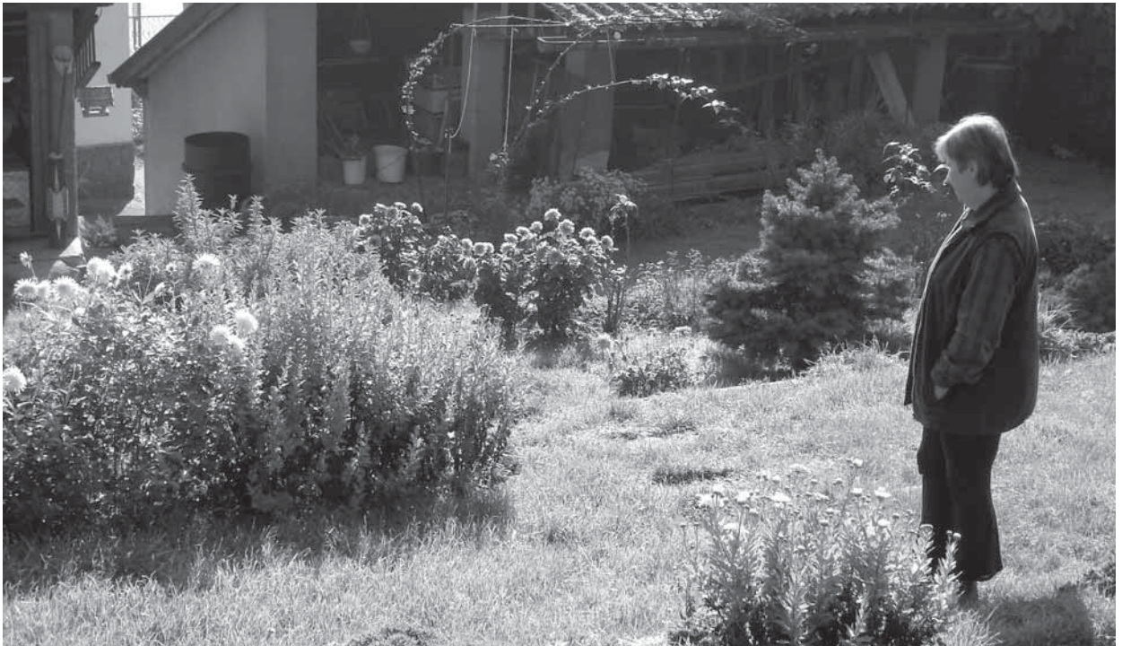
Zahrada představuje smysluplné využití času, kreativní činnost, kde výsledky práce jsou zřejmé a přinášejí uspokojení (Davlé, 2007)