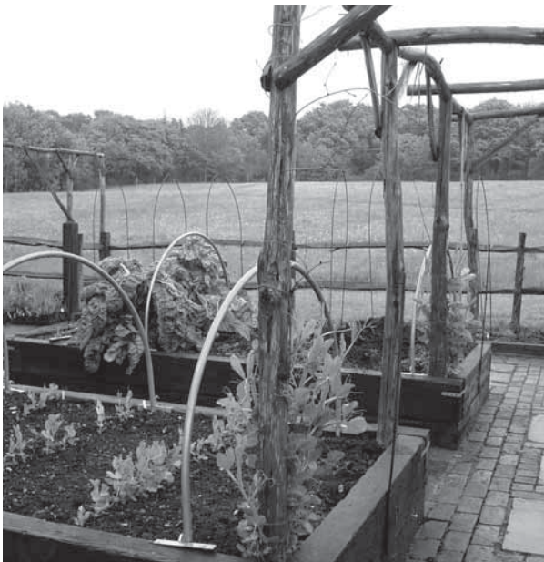
Vyvýšené záhony umožňují i hůře mobilním uživatelům zahrady věnovat se pěstitelské činnosti (Anglie, 2005)