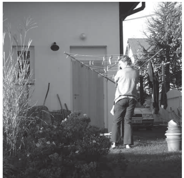
Některé domácí práce jako žehlení nebo sušení prádla mohou být vykonávány venku v zahradě (Praha a Klecany 2007)