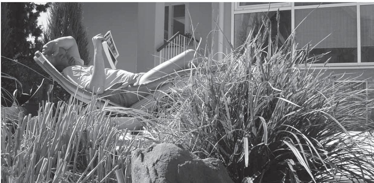
Zahrada by měla naplňovat i potřeby pasivního odpočinku (Praha, 2007)