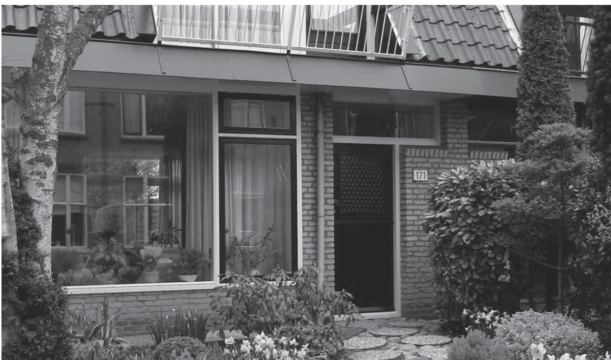
Velká nečleněná okna bez záclon a žaluzií s nízkým parapetem rozšiřují prostor zahrady i do interiéru domu, což může být důležité např. pro starší lidi upoutané na lůžko