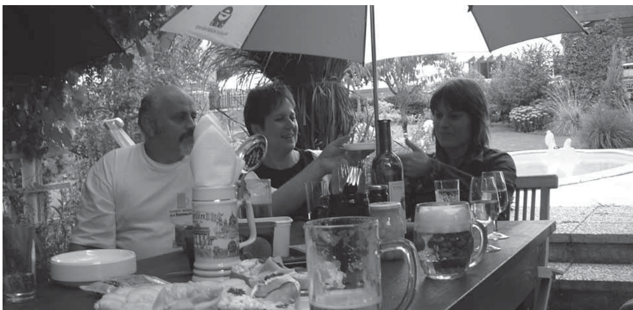
Zahrada nabízí při grilování, zahradní party nebo jiných oslavách příležitosti k sociálnímu kontaktu (Praha, 2004)